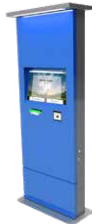
Check-In Station Outdoor