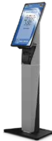
Check-In Station Indoor