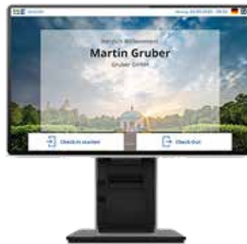
Check-In Station Desktop